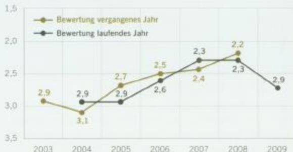
Angaben in Prozent, n = 481

Die Interim-Manager sehen die Marktlage durch die Krise etwas weniger rosig als in den vergangenen Jahren, wie eine im Februar veröffentlichte Umfrage der Ludwig Heuse GmbH zeigt.