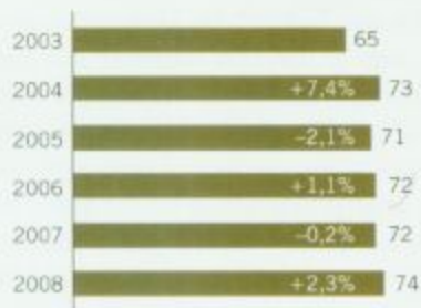
Angaben in Prozent, n = 481

Die durchschnittliche Auslastung der Interim-Manager hat sich über die Jahre äußerst positiv entwickelt. 2008 hatten die Zeitarbeiter unter den Führungskräfte so viel zu tun wie nie zuvor.